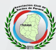
ASOCIACION CIVIL DE SORDOS DE PARANA