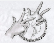
ESCUELA ESPECIAL N° 513 - LA MATANZA