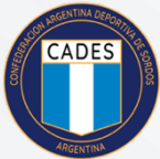
CONFEDERACION ARGENTINA DEPORTIVA DE SORDOS

Entidades confederadas, instituciones, asociaciones afiliadas / adheridas, agrupaciones de personas sordas, y empresas amigas: