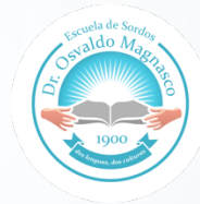
ESCUELA BILINGÜE PARA NIÑOS/AS, JÓVENES Y ADULTOS CON DISCAPACIDAD AUDITIVA Y FORMACIÓN INTEGRAL N° 29 DE 18 "DR. OSVALDO MAGNASCO"