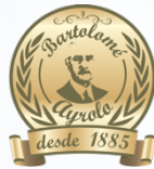
ESCUELA BILINGÜE PARA NIÑOS/AS, JÓVENES Y ADULTOS CON DISCAPACIDAD AUDITIVA Y FORMACIÓN INTEGRAL N° 28 DE 16 "PROF. BARTOLOMÉ AYROLO"