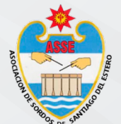
ASOCIACION DE SORDOS DE SANTIAGO DEL ESTERO